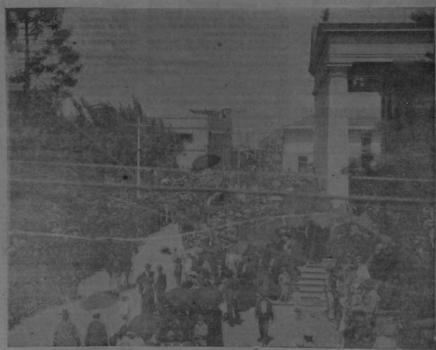
El cortejo y la tropa frente a la Catedral, en el momento de salir el féretro